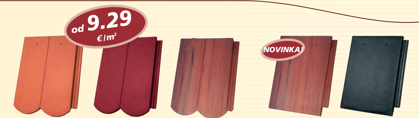
Tehlovo červená, Višňovo červená, Antická červená, Antická červená, Carbon