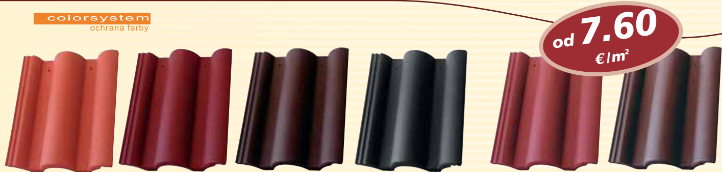
Tehlovo červená, Višňovo červená, Hnedá, Antracit, Červená, Hnedá